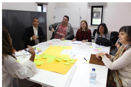
1º Evento multiplicador em Portugal (Maio de 2018) Organização CML, TESE, UCP e CECO A: "Motivação e mobilização dos jovens em situação NEET"

O projeto "Escolhe o nosso futuro" da Espanha (GP ES 3) apoia a inserção de jovens refugiados através da conscientização das empresas regionais para a sua inserção profissional.