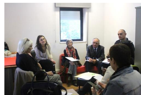
1º Evento multiplicador em Portugal (Maio de 2018) Organização CML, TESE, UCP e CECO: “Práticas e ferramentas de trabalho com os jovens em situação NEET”

A intervenção “ Choose your futureFuture ” na Espanha (GP ES 3) é colocada no espaço de transição entre a orientação e a inserção, principalmente com os jovens imigrantes interessados em participar no programa (estágios).