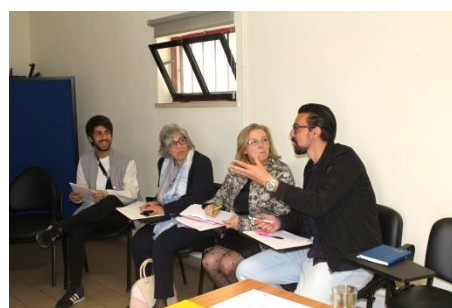
1º Evento multiplicador em Portugal (Maio de 2018) Organização CML, TESE, UCP e CECO: “Caracterização dos jovens em situação NEET”

O Programa Academia (GP UK 6) apoia a orientação social e profissional de jovens, facilitando a definição de objetivos pessoais, de educação e de formação profissional e de emprego.