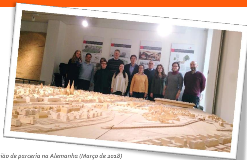
2ª Reunião de parceria na Alemanha (Março de 2018) Parceiro de acolhimento: ISOB

Duas das principais linhas de intervenção são: a intervenção nos sistemas educativo e de formação profissional (EFP), entrada ou (re) inserção no sistema; e/ou a intervenção nas áreas do trabalho e sociais.