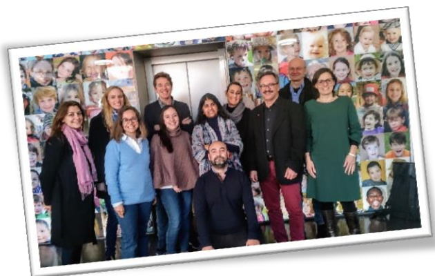
Workshop Teoria da Mudança promovido pelo parceiro Tavistock na 2ª reunião de parceria e Atividade de aprendizagem organizada pelo parceiro ISOB, na Alemanha (Março de 2018)