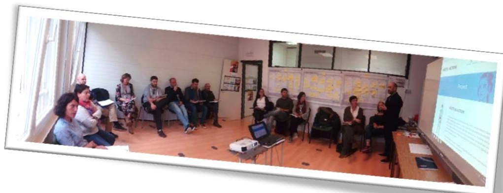
1º Evento multiplicador em Espanha (Abril de 2018) Organização Fundación Ronsel: "Principais conclusões/discussão/Análise SWOT"