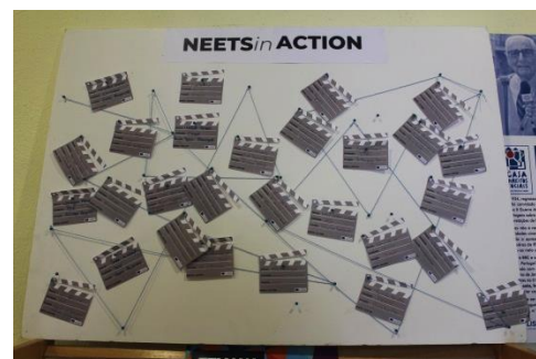
1º Evento multiplicador em Portugal (Maio de 2018) Organização CML, TESE, UCP e CECO A: "Sessão de Networking" Parceiro de acolhimento: CML

O programa Academia (GP UK 6) segue os mesmos princípios.