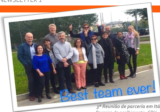
3ª Reunião de parceria em Itália (Outubro de 2018) Parceiro de acolhimento: CPV