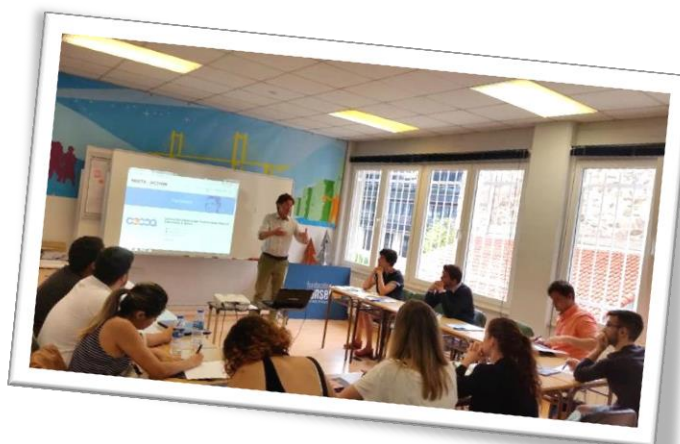
1º Evento multiplicador em Espanha (Abril de 2018) Organização Fundación Ronsel: Apresentação geral do projeto

PRÓXIMA NEWSLETTER: MODELO DE INTERVENÇÃO