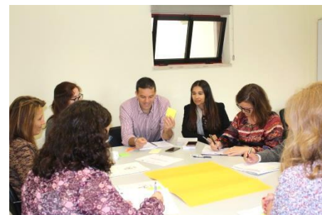
1º Evento multiplicador em Portugal (Maio de 2018) Organização CML, TESE, UCP e CECO A: "Articular os parceiros para trabalhar com jovens em situação NEET no território" Parceiro de acolhimento: CML

incubação de empresas Parkubis e com a Universidade local (UBI).