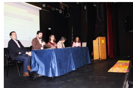
1º Evento multiplicador em Portugal (Maio de 2018): Sessão de encerramento