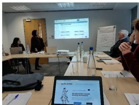
Seminário Nacional em Portugal coordenado pela TESE